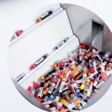
Bulk Sorter BL 1200