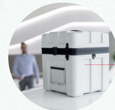
Valigetta per il trasporto di campioni