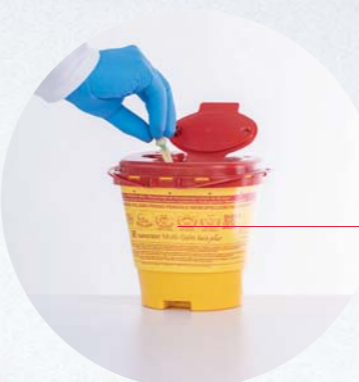
Multi-Safe Contenitori per lo smaltimento