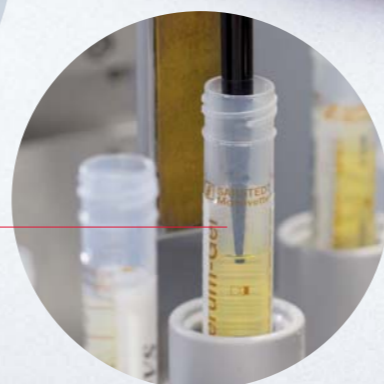
Modulo di aliquotazione AL-Flex