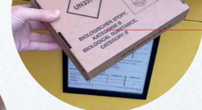
Sistemi di spedizione postale