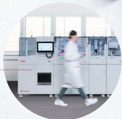
HSS – Modulo di smistamento ad alta velocità