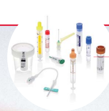
Contenitori per il prelievo di campioni