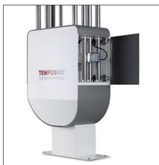
Anschlussmodul mit Bremsvorrichtung