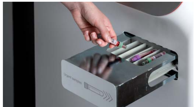
Modul für Eilproben