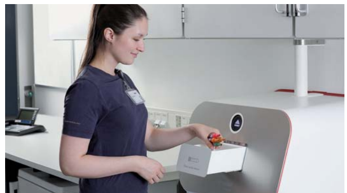
Mehrfacheingang für bis zu 25 Proben gleichzeitig