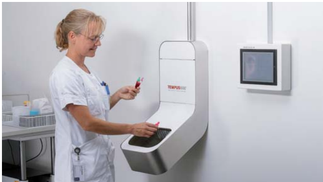
Die Proben kommen in der Empfangsvorrichtung an und können dort entnommen werden.