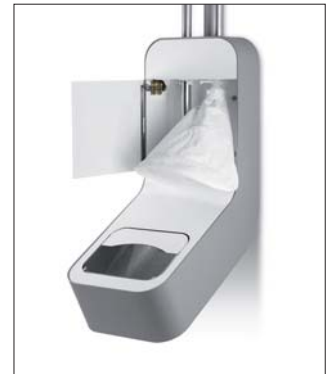
Filterbeutel zur Reinigung