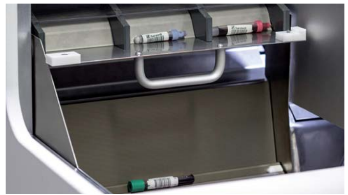
B: Modul für Eilproben