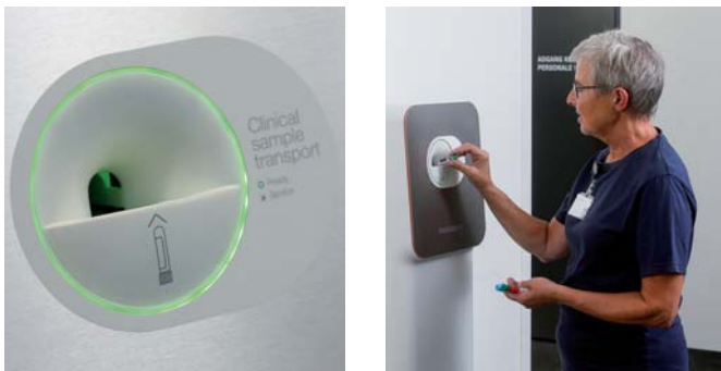
Die Probenröhrchen werden in die Eingabeöffnung der Vita-Station gesteckt.

Dank des schlanken und minimalistischen Designs passt die Sendestation an fast alle Standorte und braucht nur sehr wenig Platz.