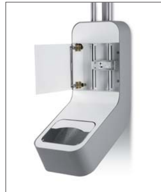
Empfangsvorrichtung mit Bremsmodul