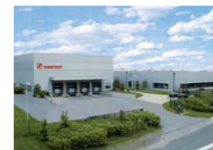
ブランド=エルビストルフ、ザクセン州、ドイツ