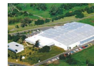
アデレード、オーストラリア