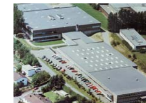
ヴィール、ノルトライン=ヴェストファーレン州、ドイツ