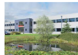
マルネー、フランス

ザルスタット製品は世界31地域にザルスタット100%出資で設立された現地法人及び代理店を通じて世界規模で販売され、サービス活動も同時に行われています。