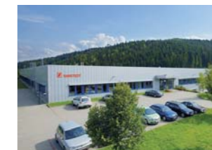
クリンゲンタール、ザクセン州、ドイツ